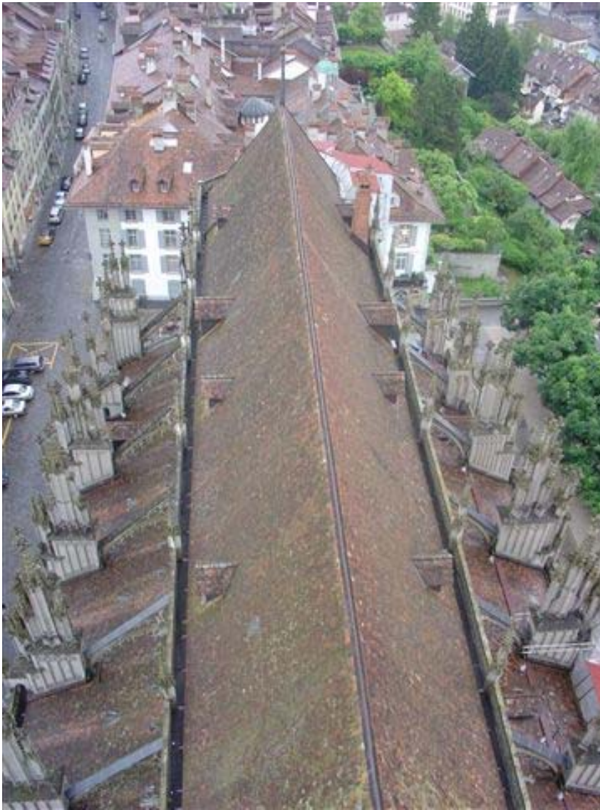
Faszinierend: Das Schiff des Berner Münsters aus der Vogelschau.