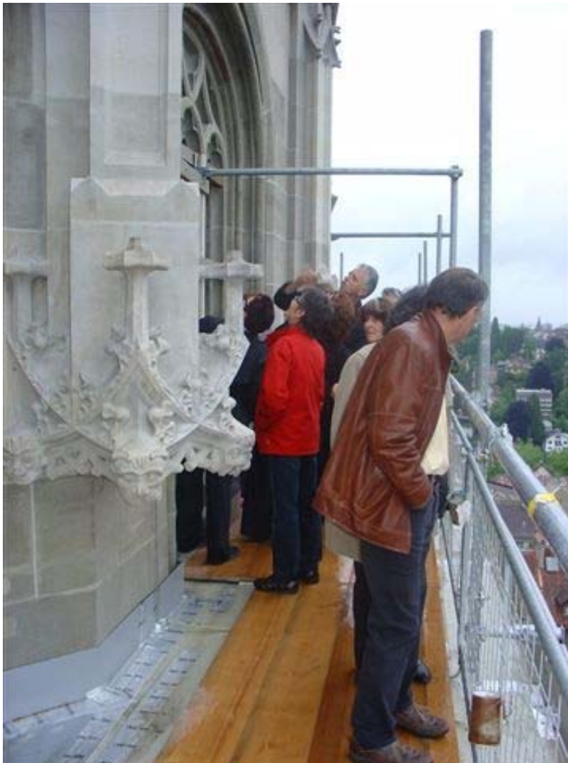
Diese Attraktion bleibt den Besuchern sonst verwehrt: Ein Blick vom Turmgerüst.