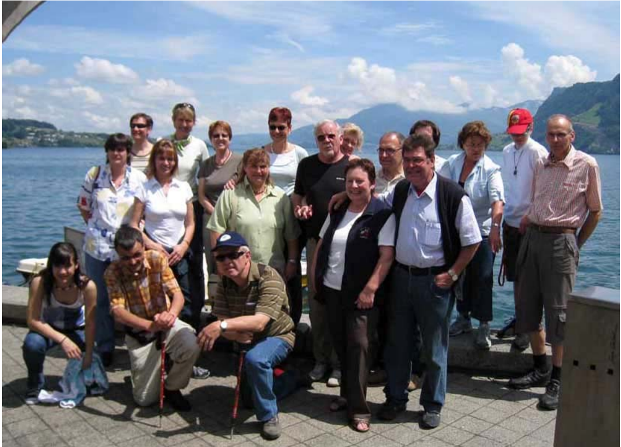
Die 22 Teilnehmenden genossen einen interessanten und abwechslungsreichen Tag.