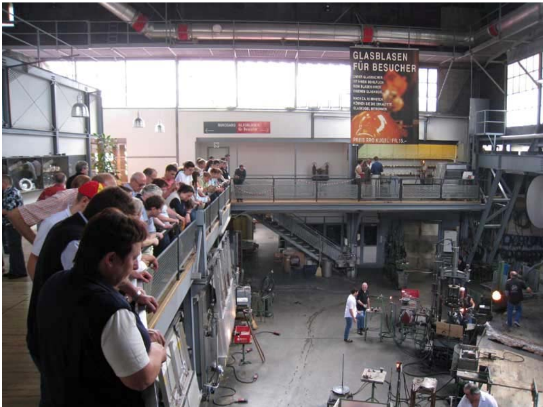
Das Herzstück der Glasi Hergiswil: Die SVMB-Besucher blicken fasziniert auf die Handwerker-Plattform.

Nach einer kurzen Begrüssung erlebten die Teilnehmenden ein Highlight der Besichtigung. Von einer grossen Galerie aus genossen sie beste Sicht auf die Glasmacher-Plattform und konnten so den Handwerkern bei ihrer rhythmischen Arbeit zuschauen. Mit Bewunderung verfolgten die SVMB-Besucher die Arbeit am Herz der Glasi Hergiswil, dem Ofen. Mit der artistischen Mischung von Blasen, Giessen und Formen wurde den anwesenden eindrücklich vorgeführt, wie aus einer gläsernen Flüssigkeit kunstvolle Glasjuwelen entstehen können. Schliesslich wagten sich einige Besucher selbst als Glasbläser.