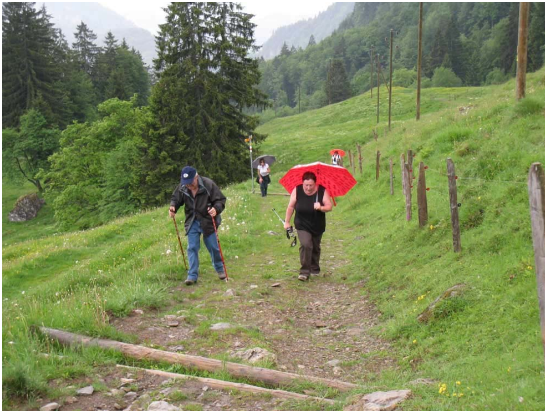
Abwechslungsreich war der Tag auch bezüglich des Wetters. Beim Aufstieg zur «Alp Gschwänd» trotzten die Wanderer dem Regen.